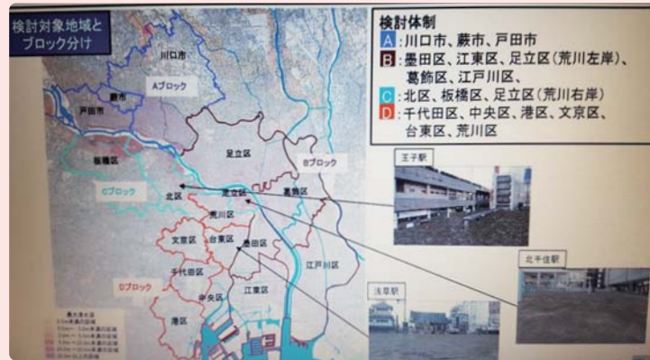
ぜひ、荒川タイムラインをご覧ください