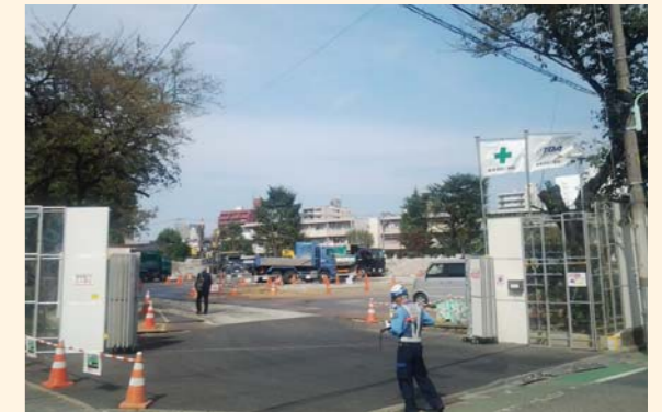
旧大山小跡地の現状 「すっかり校舎も体育館も瓦礫となってしまいました」

その後、民間所有者の都合により、その所有部分が、マンション業者に売却され、区有地と民地が下図のようにバラバラのまま、民地のマンション建設が発表されました。